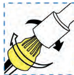
Un chasse-écrou de 13mm (1/2 po) peut également être utilisé.