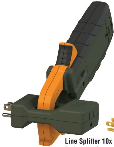
Line Splitter 10x Divisor de línea x10 Séparateur de lignes 10x