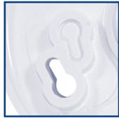
With Knockouts Avec débouchures Con Agujeros Ciegos