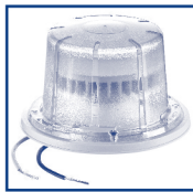
Lampholder & Lamp Douille et lampe Portalámpara y Lámpara