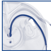
Wire Leads Fils de douille Conductores de Alambre